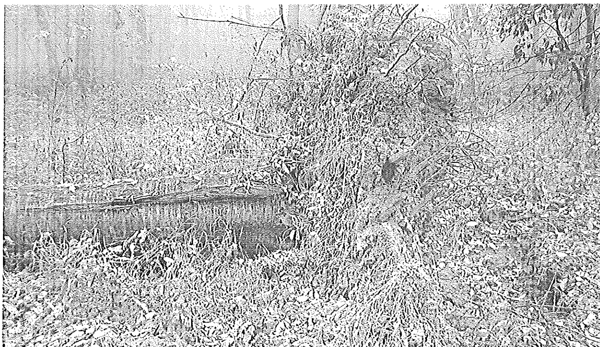
UP II, ua 80B, pădure proprietate de stat, S= 16 ha, 16.10.2017